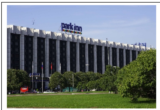
Внешний вид гостиницы